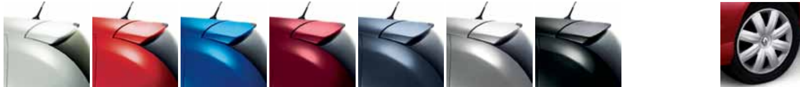
BÍLÁ GLACIER (369)